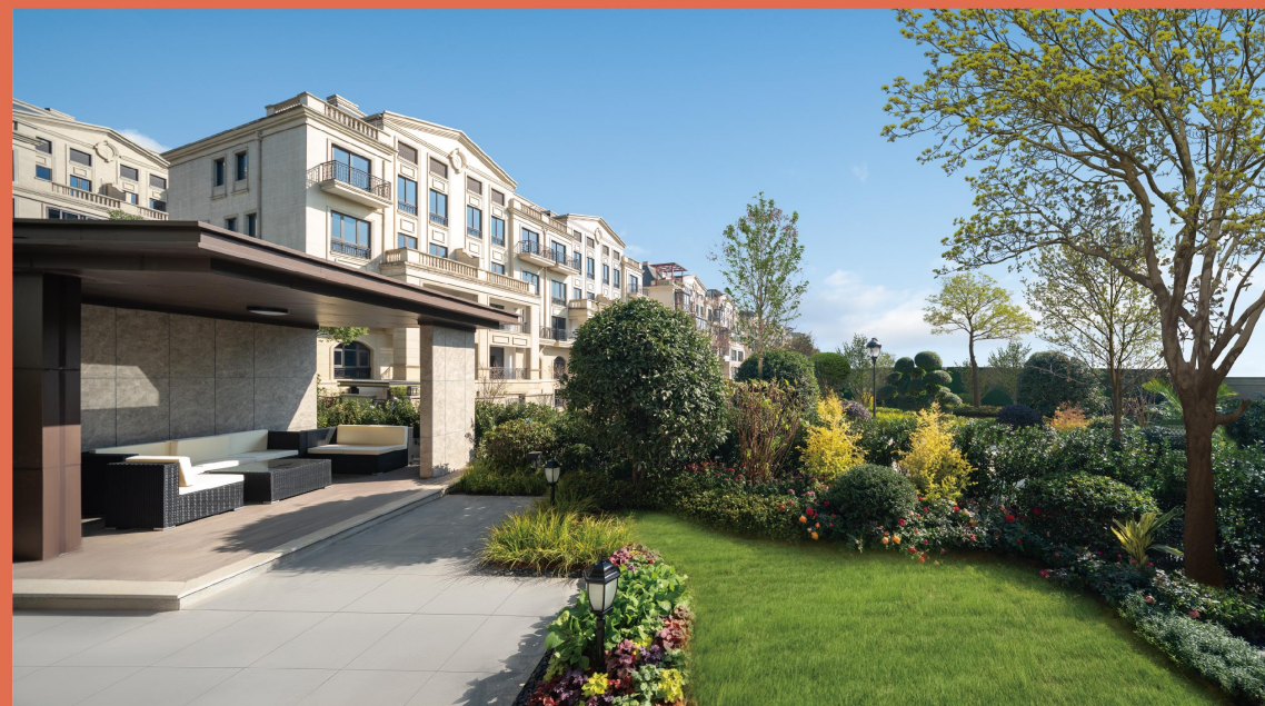
天工名爵府·江山样板房开放