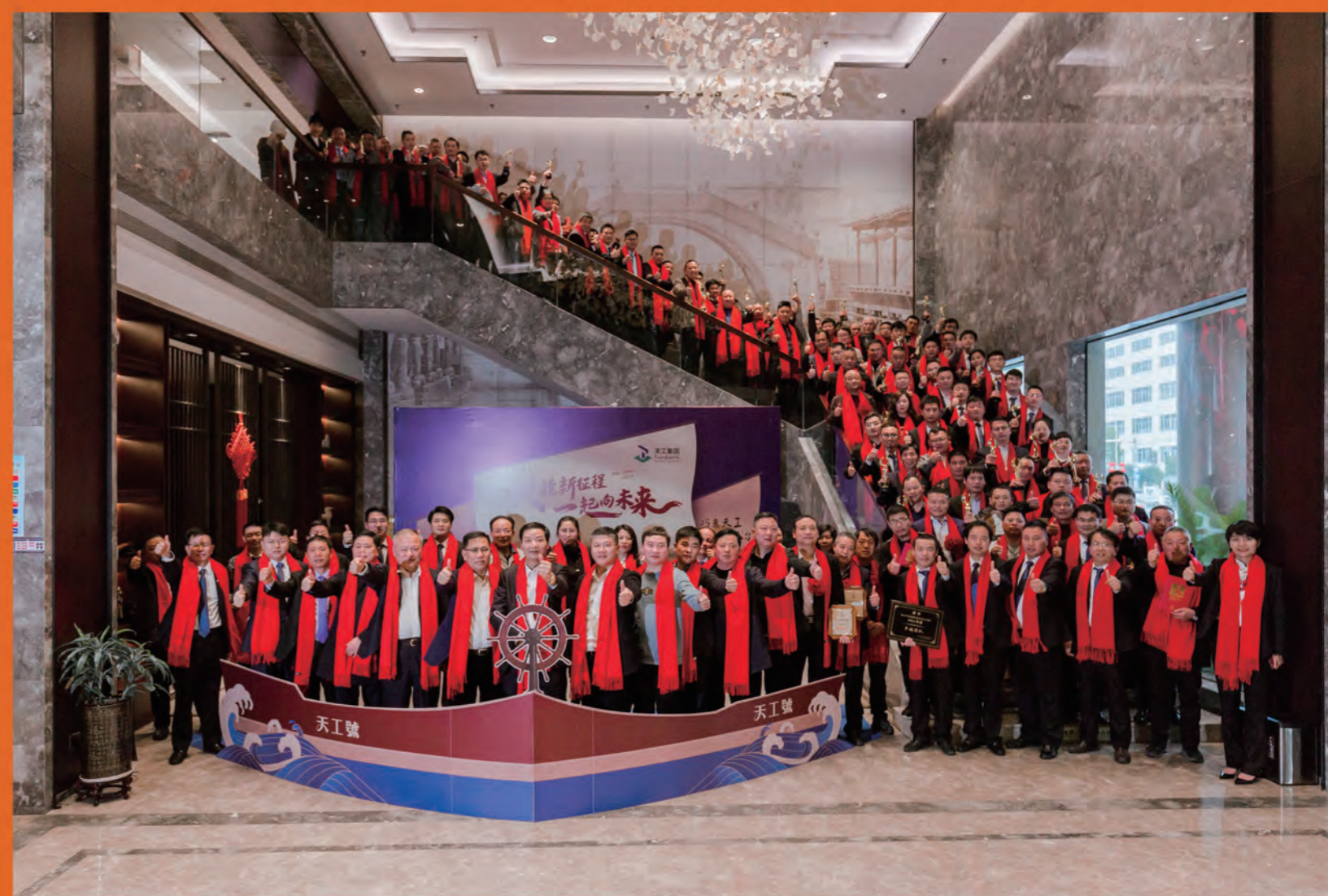
天工集团2021年度总结表彰大会

地址：绍兴市柯桥区柯桥街道华宇路150号天工大厦23楼 电话：0575-85654518 传真：0575-85654518 电子邮箱：zhejiangtg@163.com 网址：www.zjtgroup.com