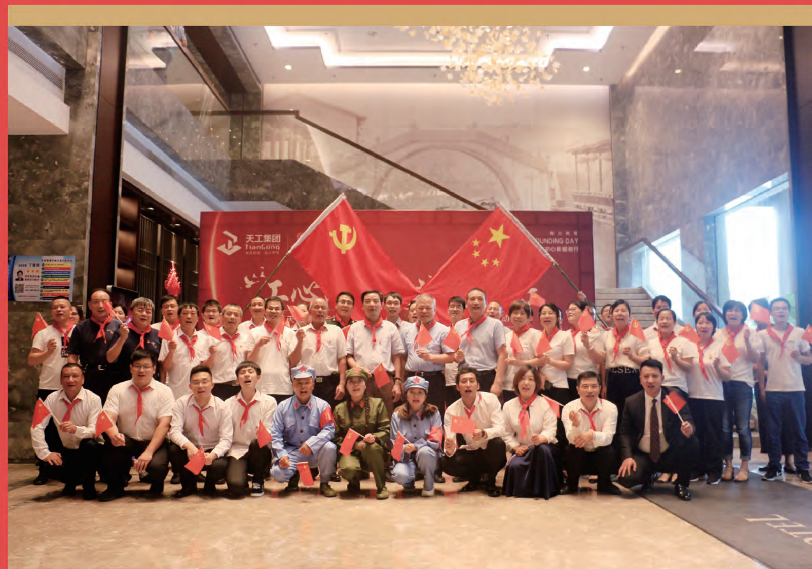
工心向党 共咏美好——天工集团2021年度七一党建活动合影

地址: 绍兴市柯桥区柯桥街道华宇路150号天工大厦23楼 电话: 0575-85654518 传真: 0575-85654518