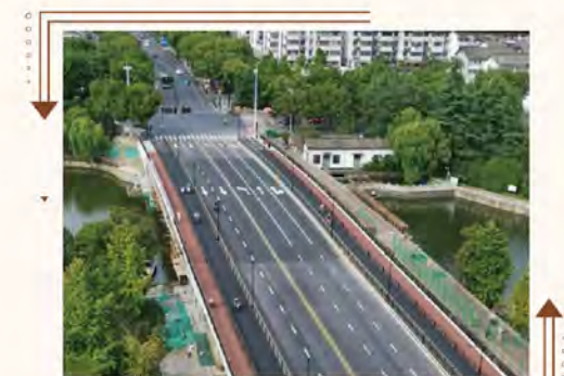
▲改造后的城南大桥实景图

10月14日下午，城南大桥拓宽改造工程顺利 通过五方主体完工验收，宣告正式完工并全面恢 复通车。据悉，该工程对桥梁的承载力及耐久性 都进行了提升改造，标志着这座连接老城区的重 要桥梁重新焕发生机，继续发挥市区南北主通道 的重要作用，为市民出行提供最大的便利。