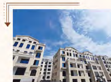
30#~42#楼外墙涂料均完成，场外施工中；