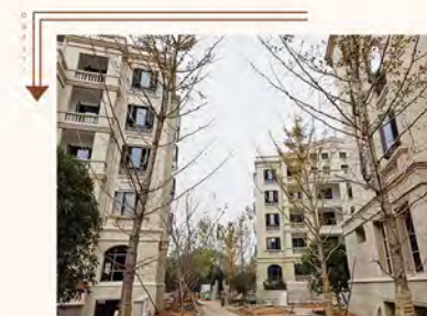
30#~34#楼铺装道路下基层已完成；