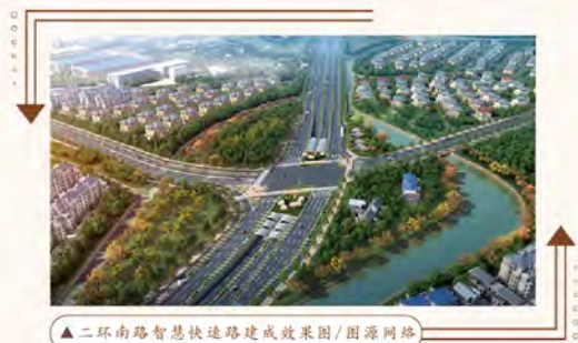
▲二环南路智慧快速路建成效果图

9月17日上午，作为主城区快速路成网成环的 关键点，二环南路智慧快速路项目正式开工，标 志着绍兴主城区绕城高架“成环连网”正式形 成。建成后将实现市区快速路闭环，并全面与杭 甬高速、绍诸高速、杭绍台高速无缝相连。