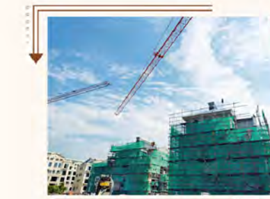
43#、44#、45#楼干挂施工中； 小区配套幼儿园主体已封顶。

时间是酿造一切伟大的见证者 感谢您一直以来对我们的信任与支持 我们将坚守天工品质 匠心筑梦，用心筑家 始终怀揣一份责任 为您向往的家园生活而努力 美好未来，让我们共同期待