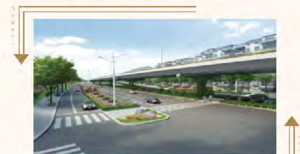
▲ 二环南路智慧快速路效果图

8月11日，二环南路智慧快速路工程EPC总承包项目完成开标，标志着项目即将正式开建。据悉，项目将在2022年亚运会开幕前完工通车。