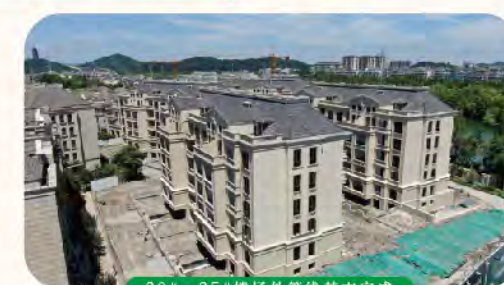
30#~35#楼场外管线基本完成