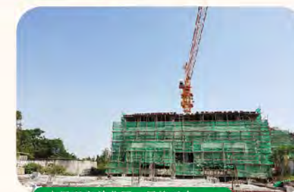
小区配套幼儿园一层施工中。

世间美好，皆值得等待 秉持初心，不负“家”期 我们将坚守天工品质 执着每一个精雕细节 怀揣着家人的殷切期望 持续向美好进发