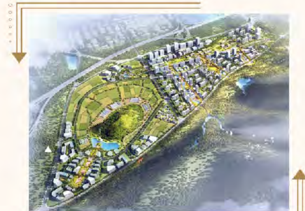
▲ 鉴湖TOD综合体规划图

近日，鉴湖地铁芳泉站TOD综合体设计规划发布，项目拟将拥有东西两个“绿芯”+“三个城市功能核”，营造“现代慢生活”的场景体验，以多维交通将整个城南板块在空间上串联起来，城南的潜力也将随之迸发。