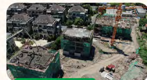
43#楼夹层施工中； 44#、45#楼主体结顶完成； 46#楼三层施工中；